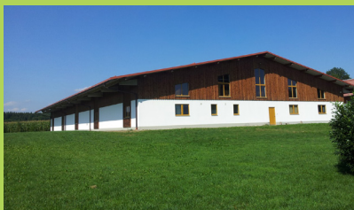
2016: Firmengebäude vor den Umbaumaßnahmen

Vor 10 Jahren sind wir an unseren heutigen Standort nach Stephanskirchen umgezogen. Dort vereinen wir heute Entwicklung, Produktion, Beratung und Versand unter einem Dach.