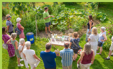
Workshops & Webinare zur Wissensvermittlung