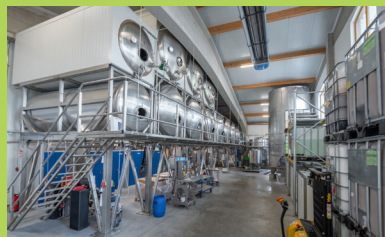
Moderne Produktions-anlage mit Robotertechnik