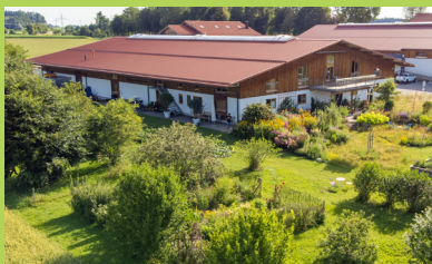
heute: ein großer Schau-garten empfängt Besucher