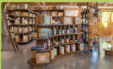
Laden & Werksverkauf mit Fachberatung