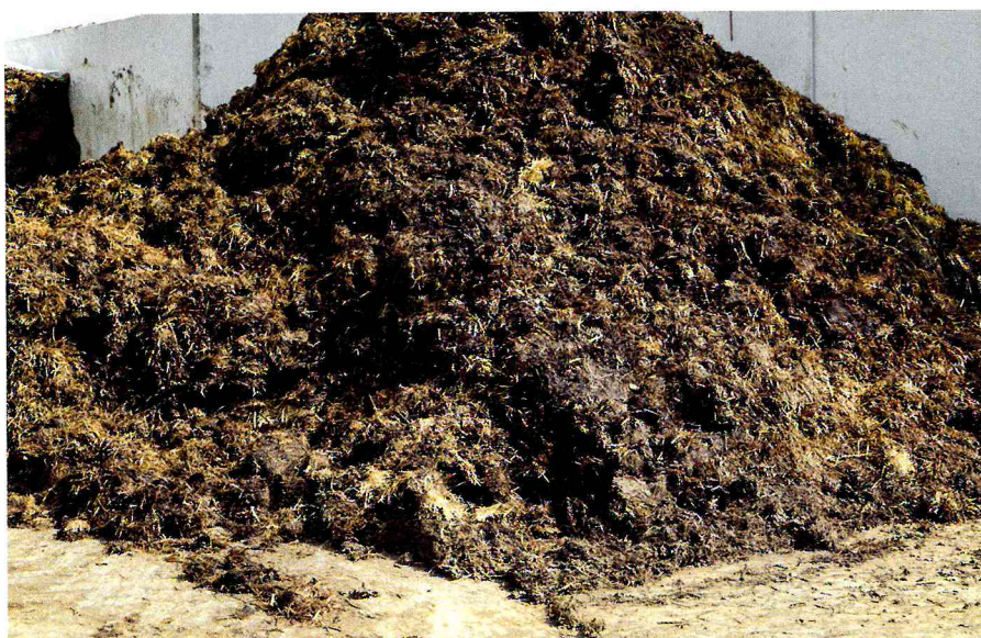
Stallmist ist ein wichtiger organischer Dünger, vor allem, wenn er, wie die Gülle, behandelt wird.