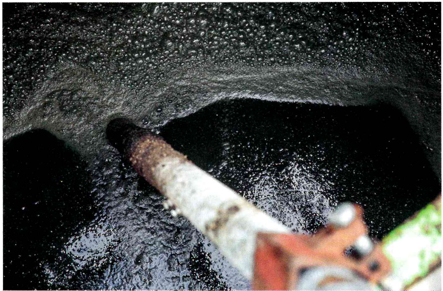
Die Gülle auf einem Schweinemastbetrieb in Niedersachsen mit rund 6.000 Schweinen ist fast geruchlos. Bei der Fütterung wird Pflanzenkohle zugesetzt, die Gülle wird behandelt.

Unbehandelte Gülle ist oft zähflüssig und muss deshalb vor der Ausbringung mit Wasser verdünnt werden. Das bringt einige Nachteile mit sich. Beim Ausbringen muss öfter gefahren werden, das kostet Zeit und Geld. Und trotz der manchmal auch wegen der Wasserzugabe separieren sich flüssige und feste Bestandteile, es sind regelrecht Streifen auf den Blättern der Pflanzen zu erkennen. Behandelte Gülle ist sämig, fließt vom Blatt herunter auf den Boden und Ätزشä-