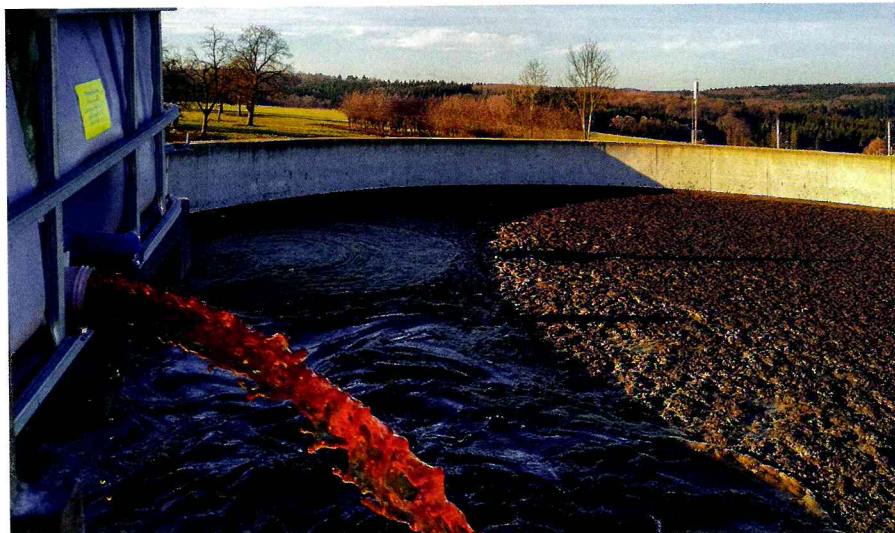
Durch die Zugabe von Mikroorganismen wird das Milieu der Gülle verändert und in eine aufbauende Richtung gelenkt.